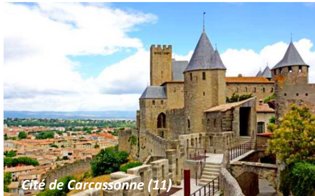
Cité de Carcassonne (11)