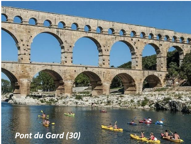
Pont du Gard (30)